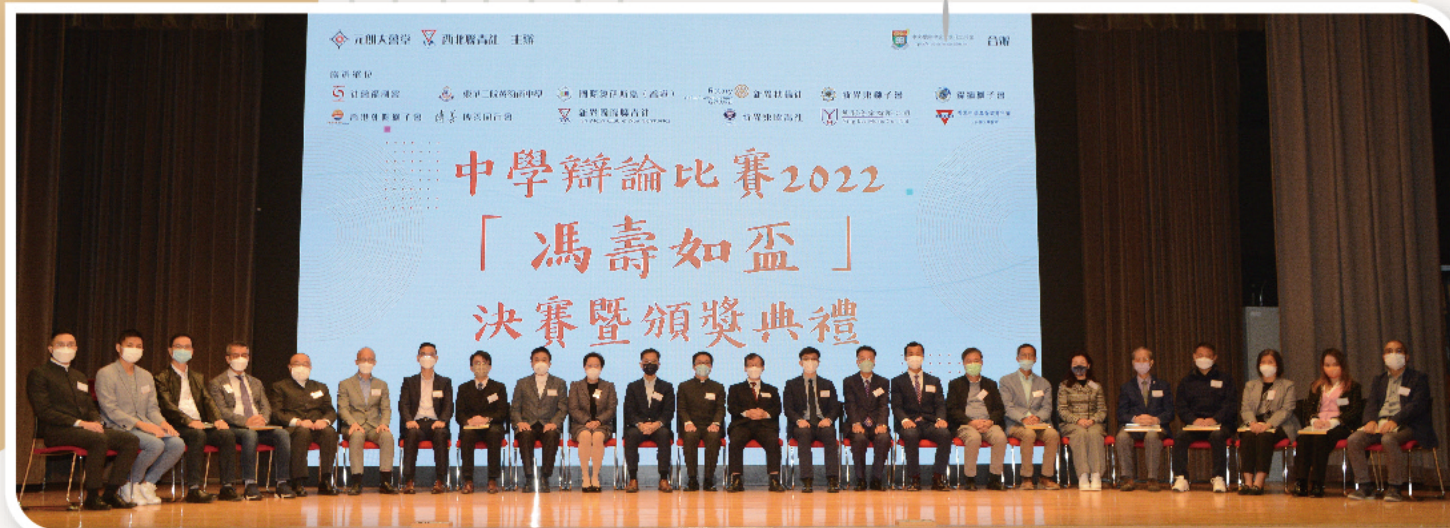
中學辯論比賽2022一眾主禮嘉賓合照