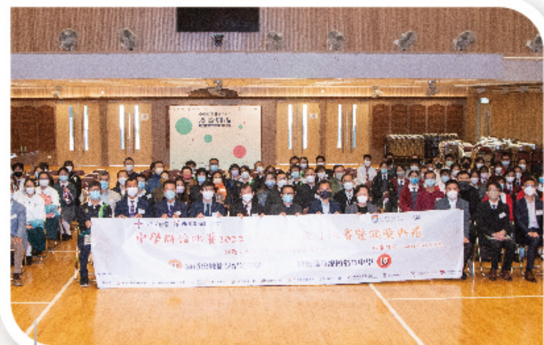
主禮嘉賓與中學辯論比賽2022得獎隊伍合照