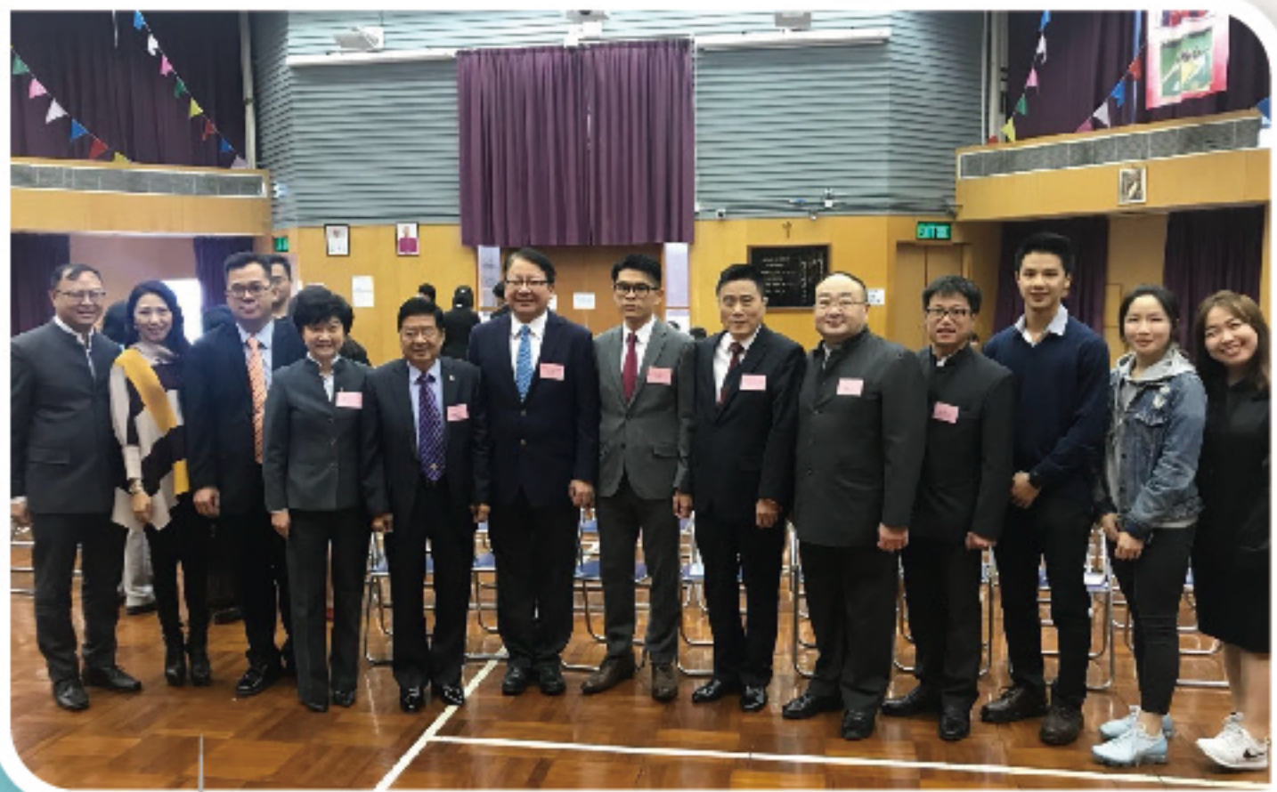
時任特首辦主任陳國基SBS IDSM太平紳士 於2017頒獎典禮後與喜賓合照