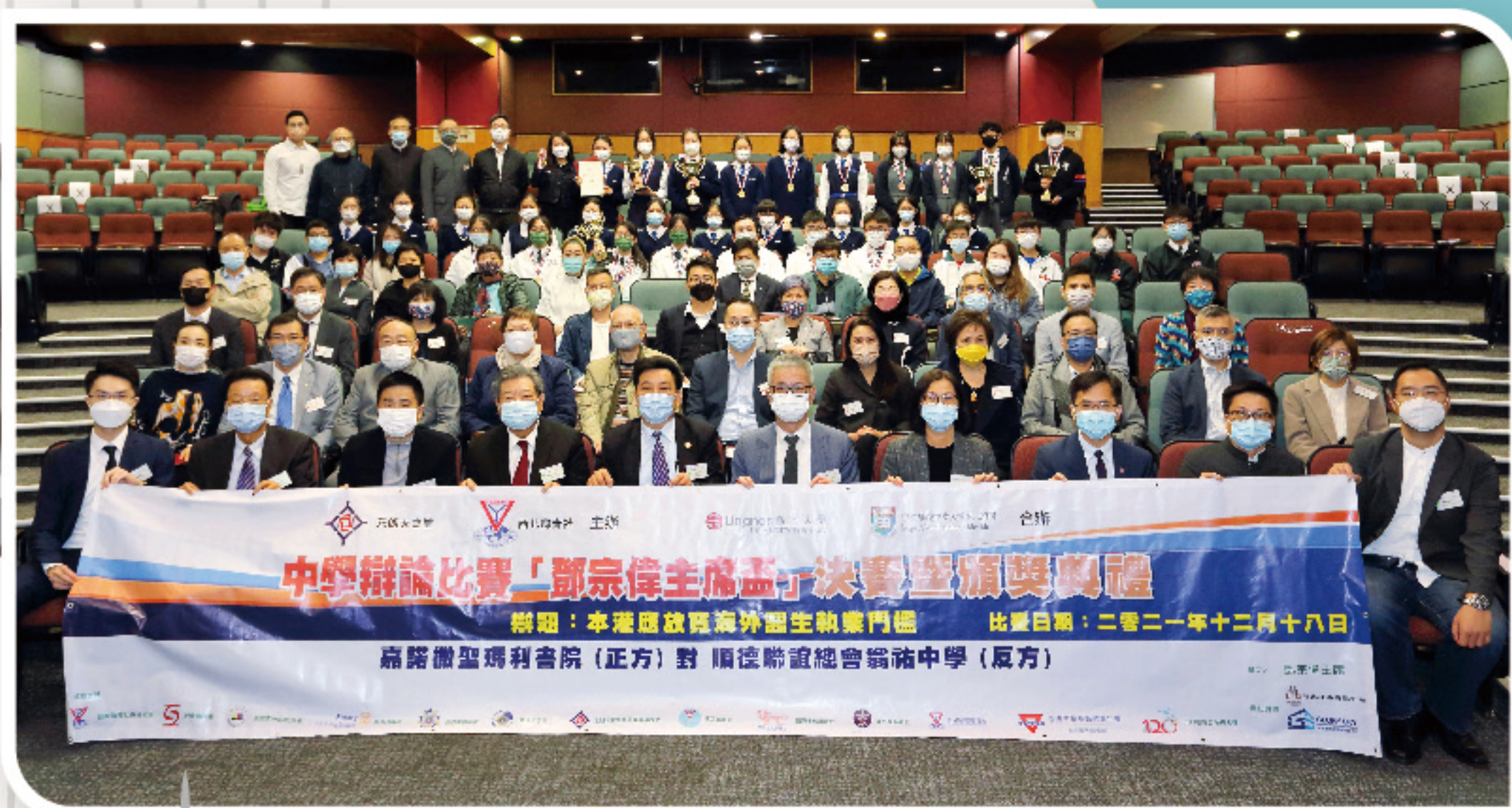
2021年得獎隊伍與一眾嘉賓合照