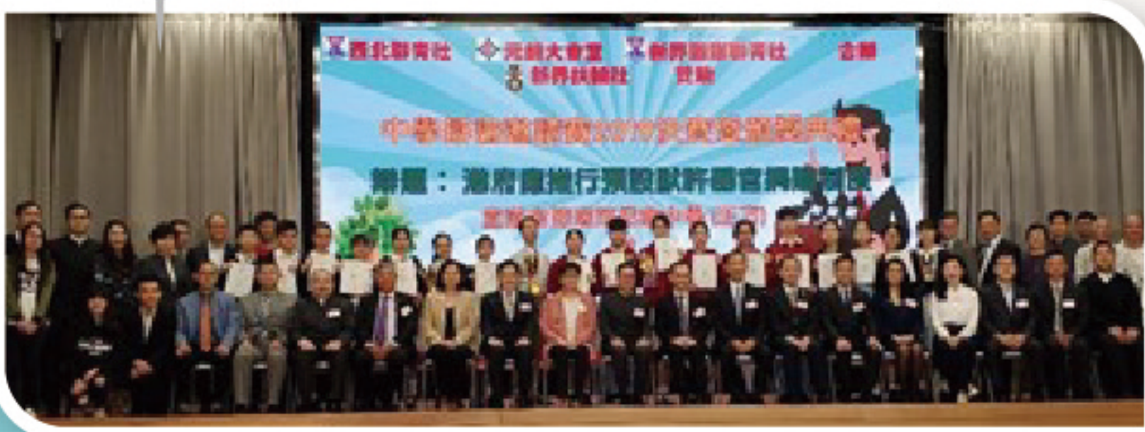
2019年辯論比賽得獎隊伍與一眾主禮嘉賓合照