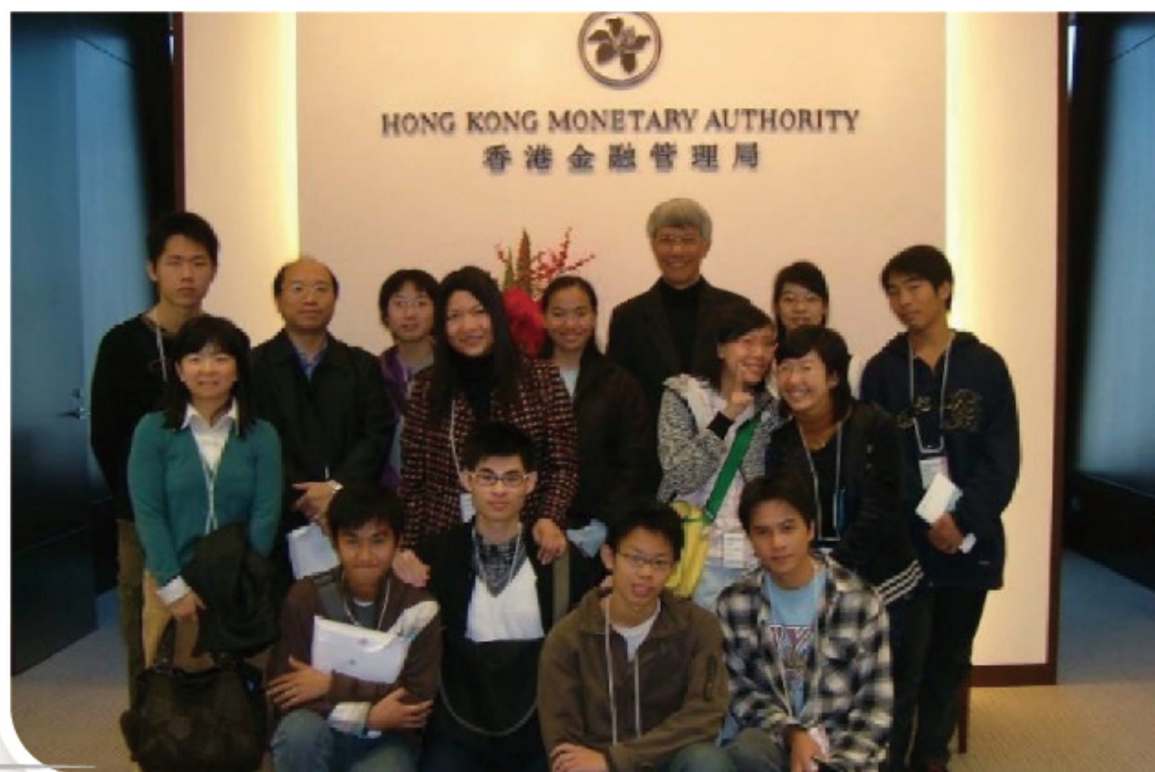
2006年比賽冠軍獲邀往金融管理局交流，並與時任 金管局總裁任志剛 GBM GBS CBE 太平紳士合照