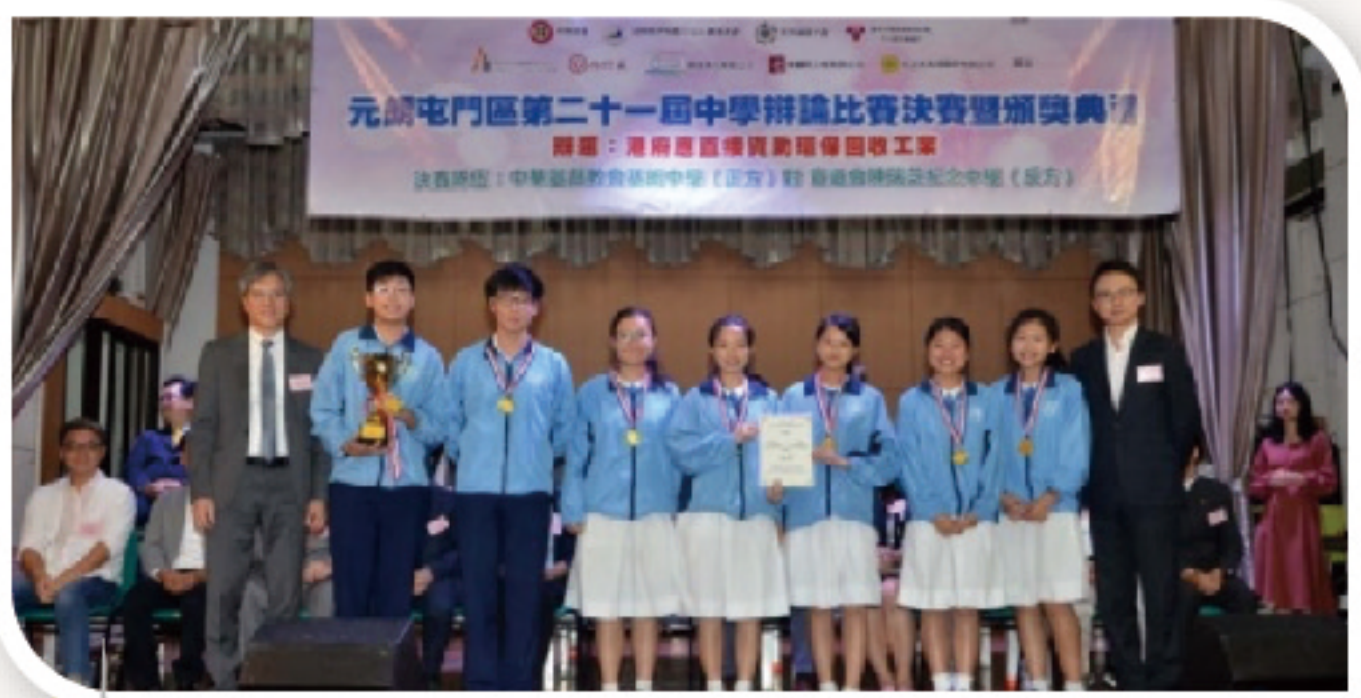
香港中文大學醫學院院長陳家亮SBS太平紳士 頒發獎項予2018年冠軍